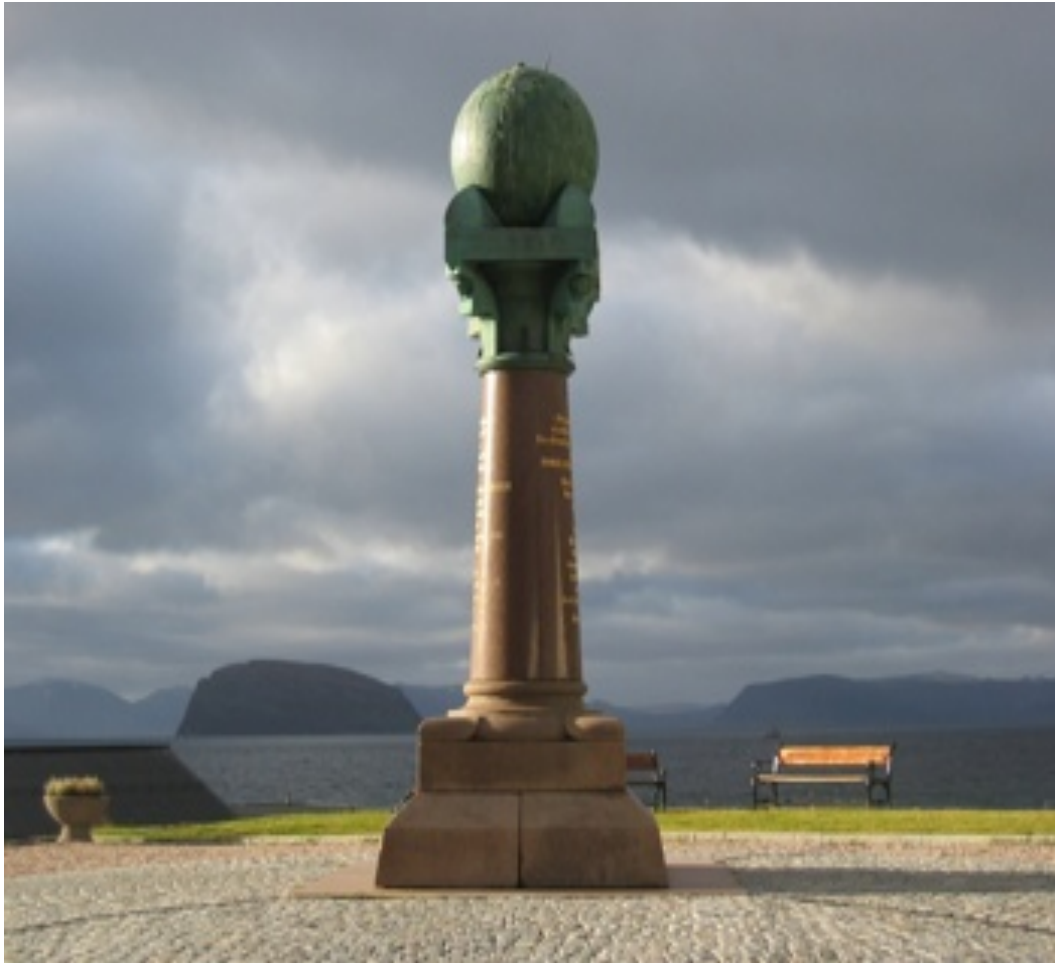
10.- Arco geodésico de Struve (2005)