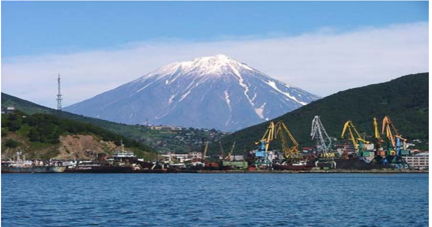
3.- Volcanes de Kamchatka (1996)