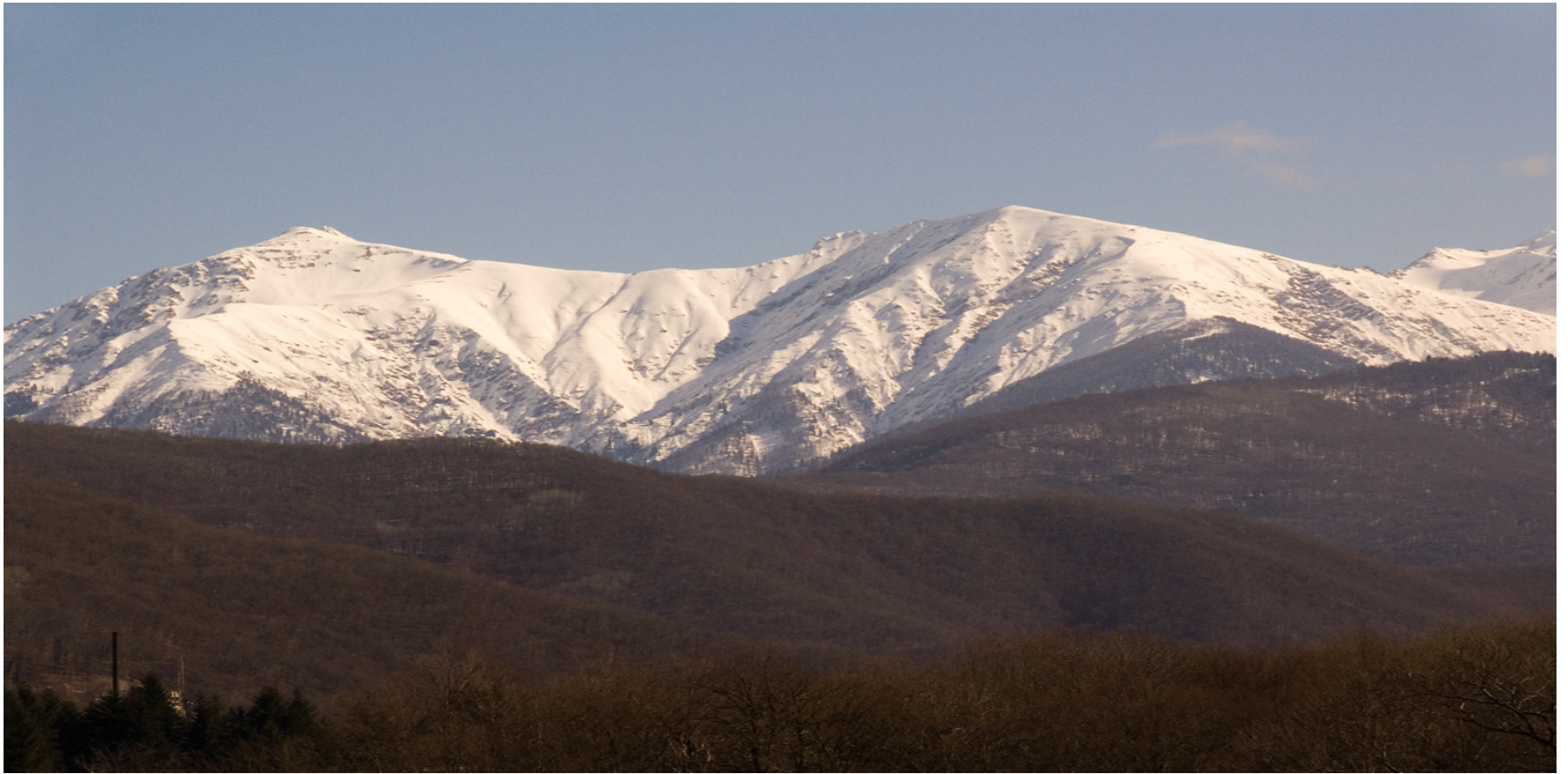
5.- Cáucaso occidental (1999)