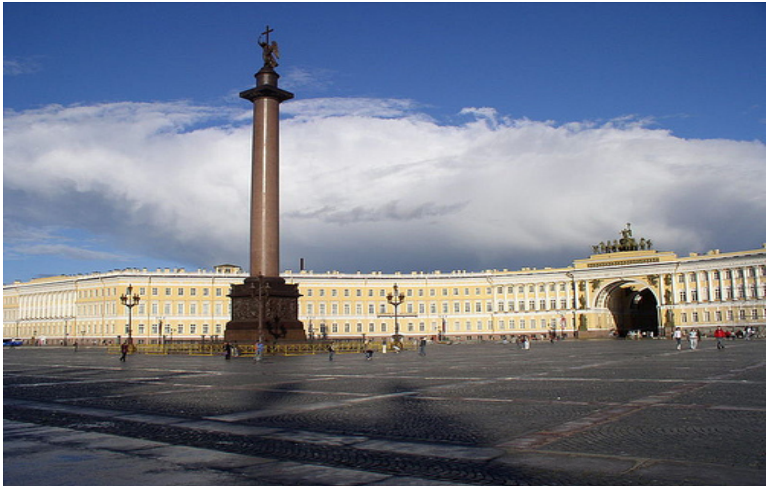
2.- Centro histórico de San Petersburgo y conjuntos monumentales anexos (1990)