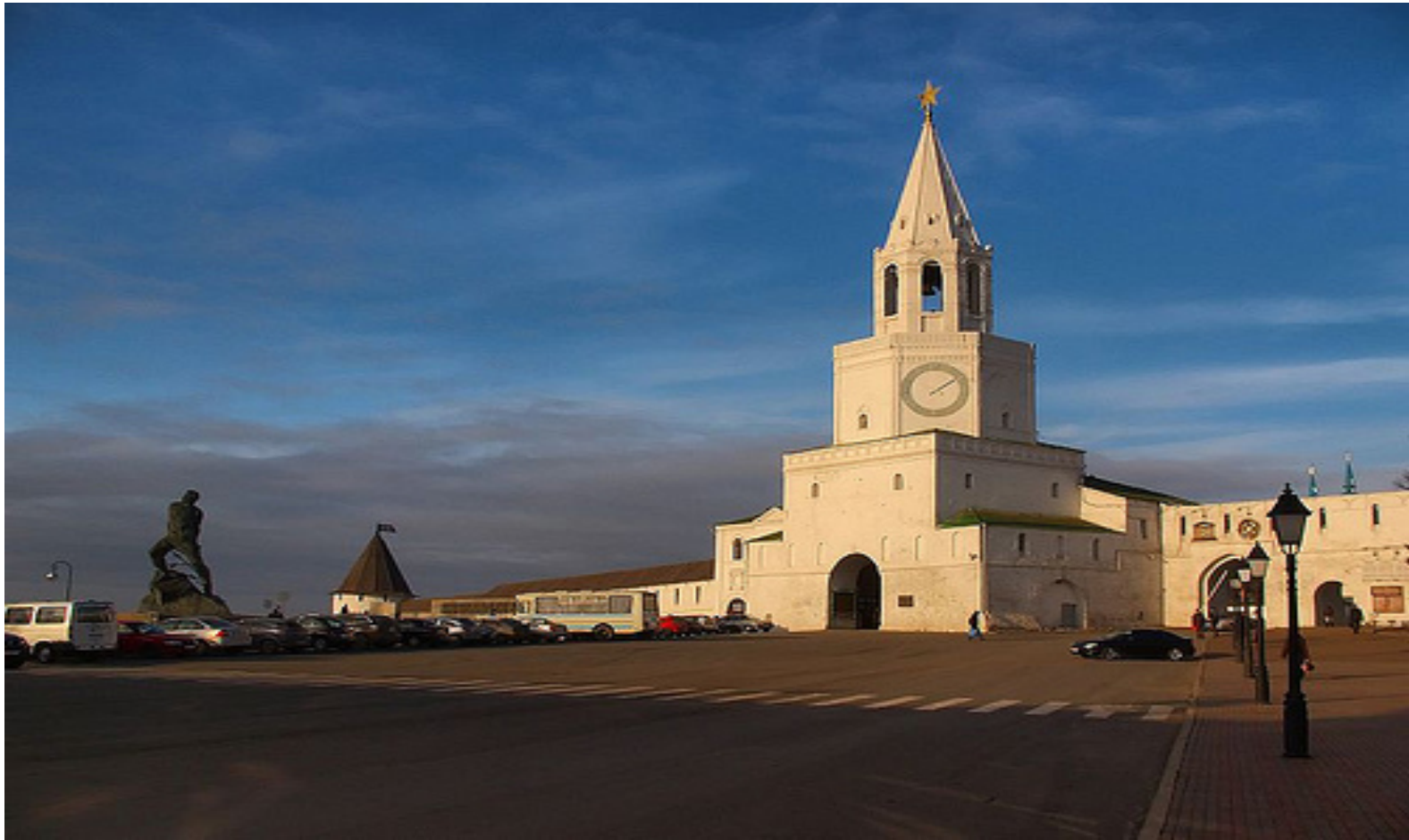
10.- Conjunto histórico y arquitectónico del kremlin de Kazán (2000)