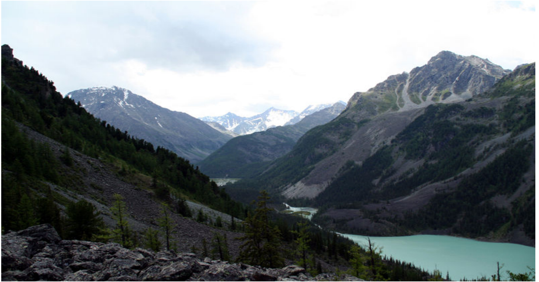
4.- Montañas Doradas del Altái (1998)