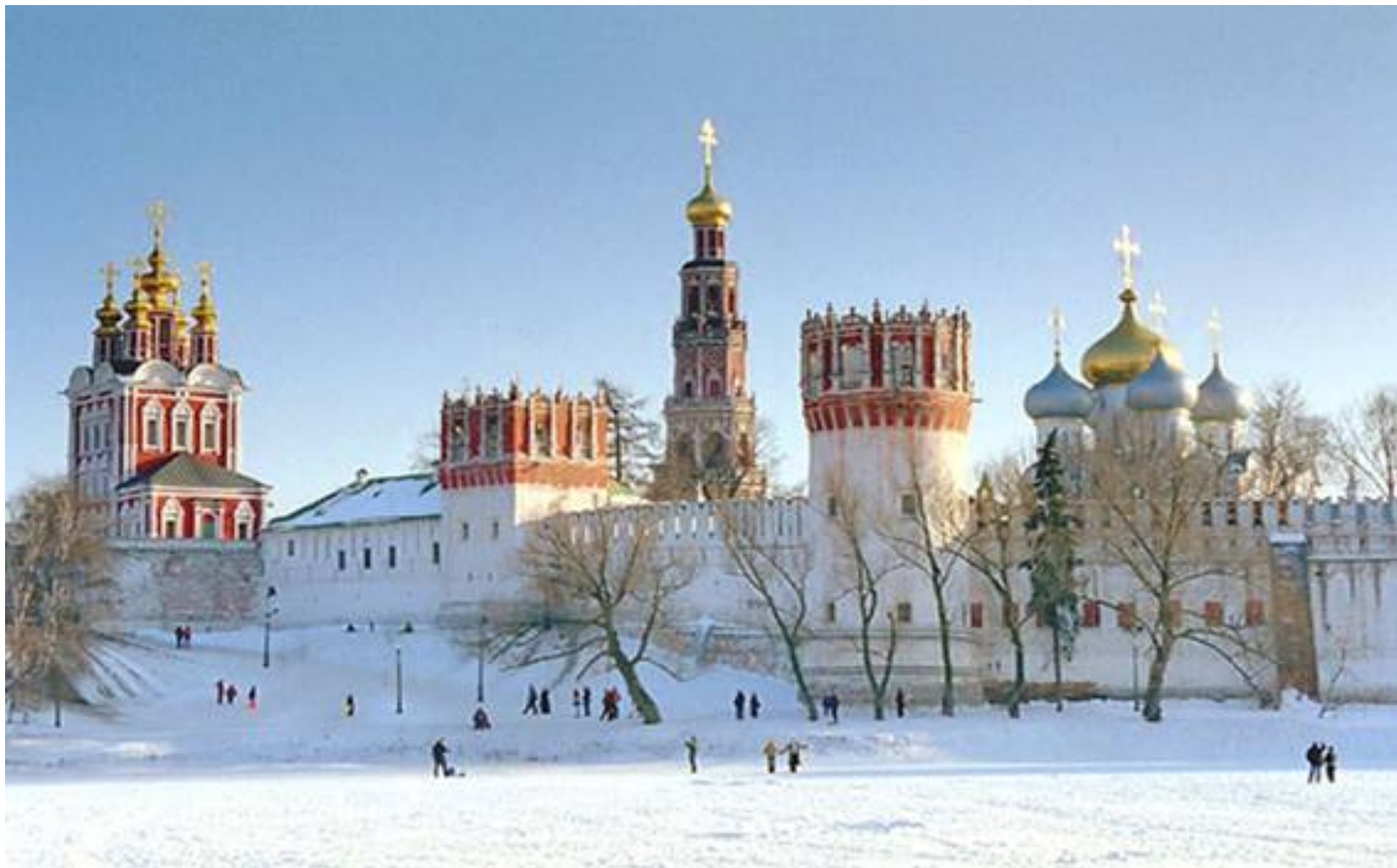
12.- Conjunto conventual de Novodevichy (2004)