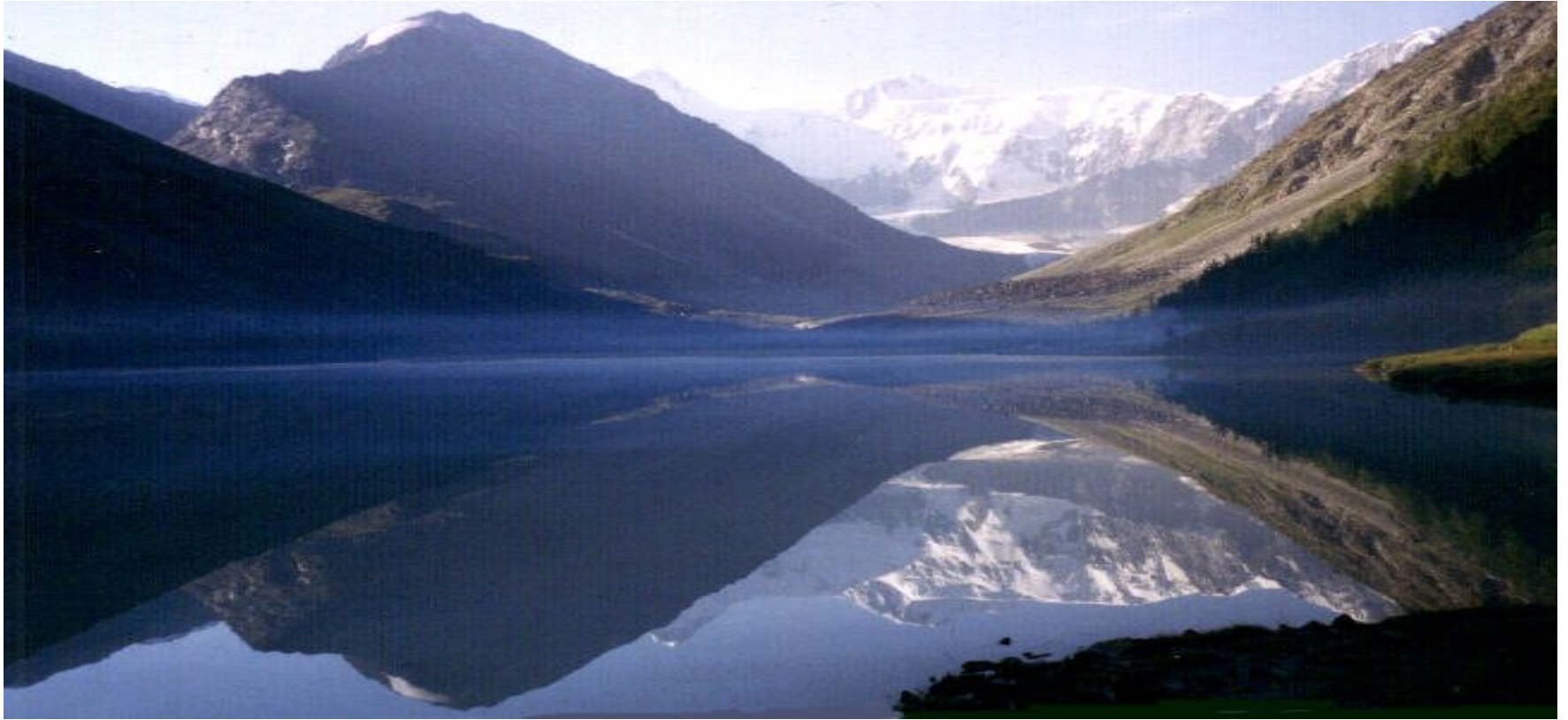
2.- Lago Baikal (1996)