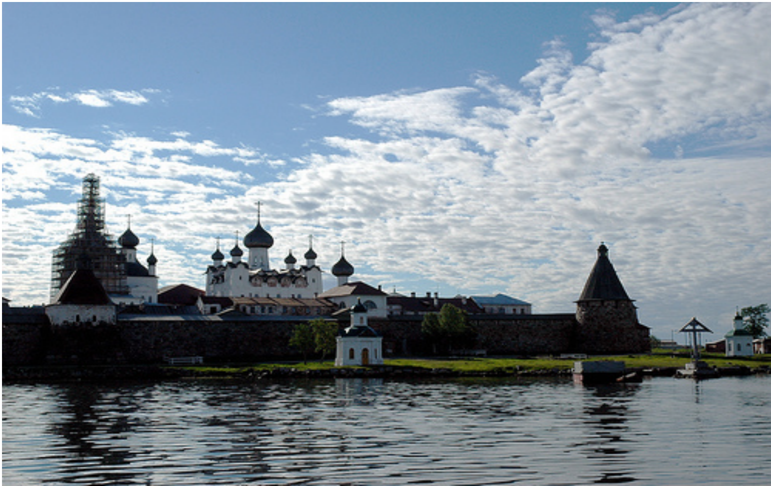
4.- Conjunto Histórico y Cultural de las Islas Solovetsky (1992)