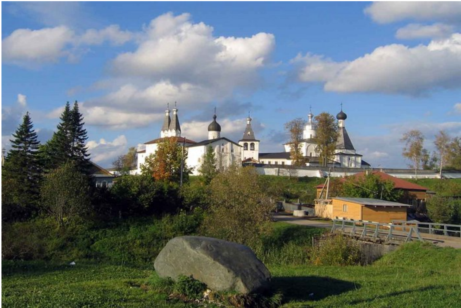
9.- Conjunto del Monasterio Ferapontov (2000)