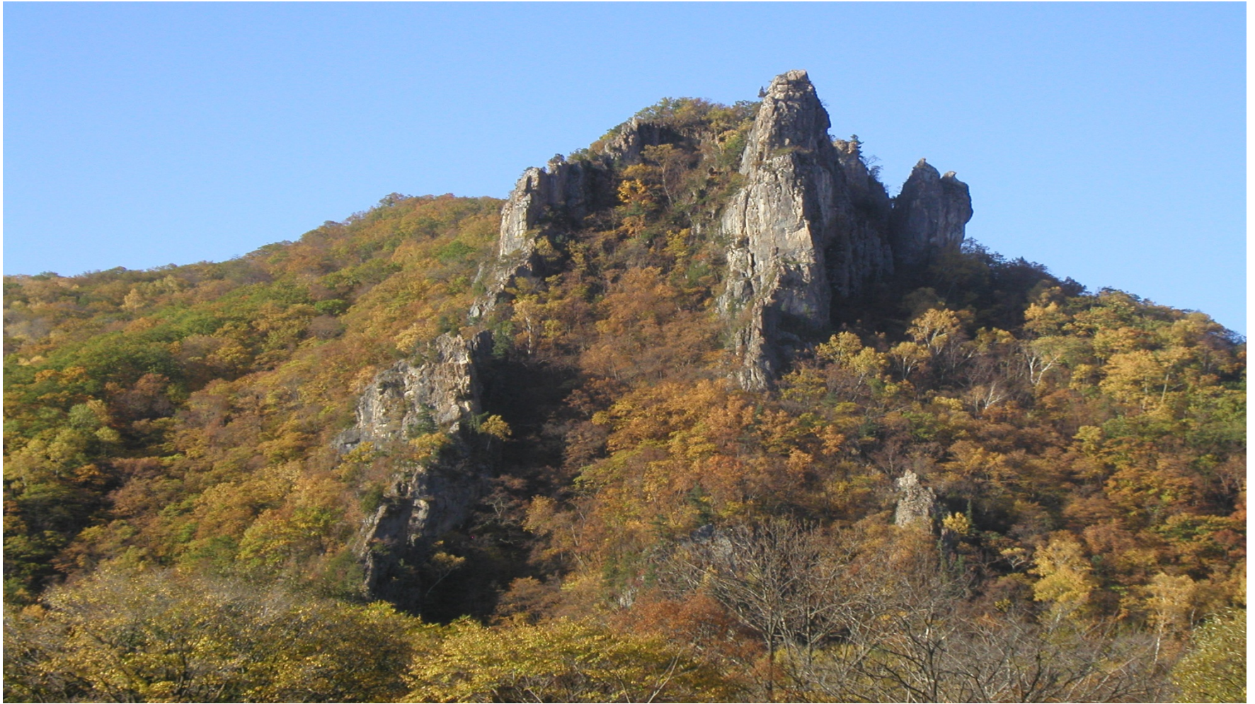
7.- Sikhote-Alin (2001)