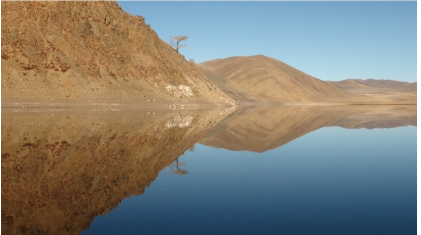
8.- Cuenca de Uvs Nuur (2003)