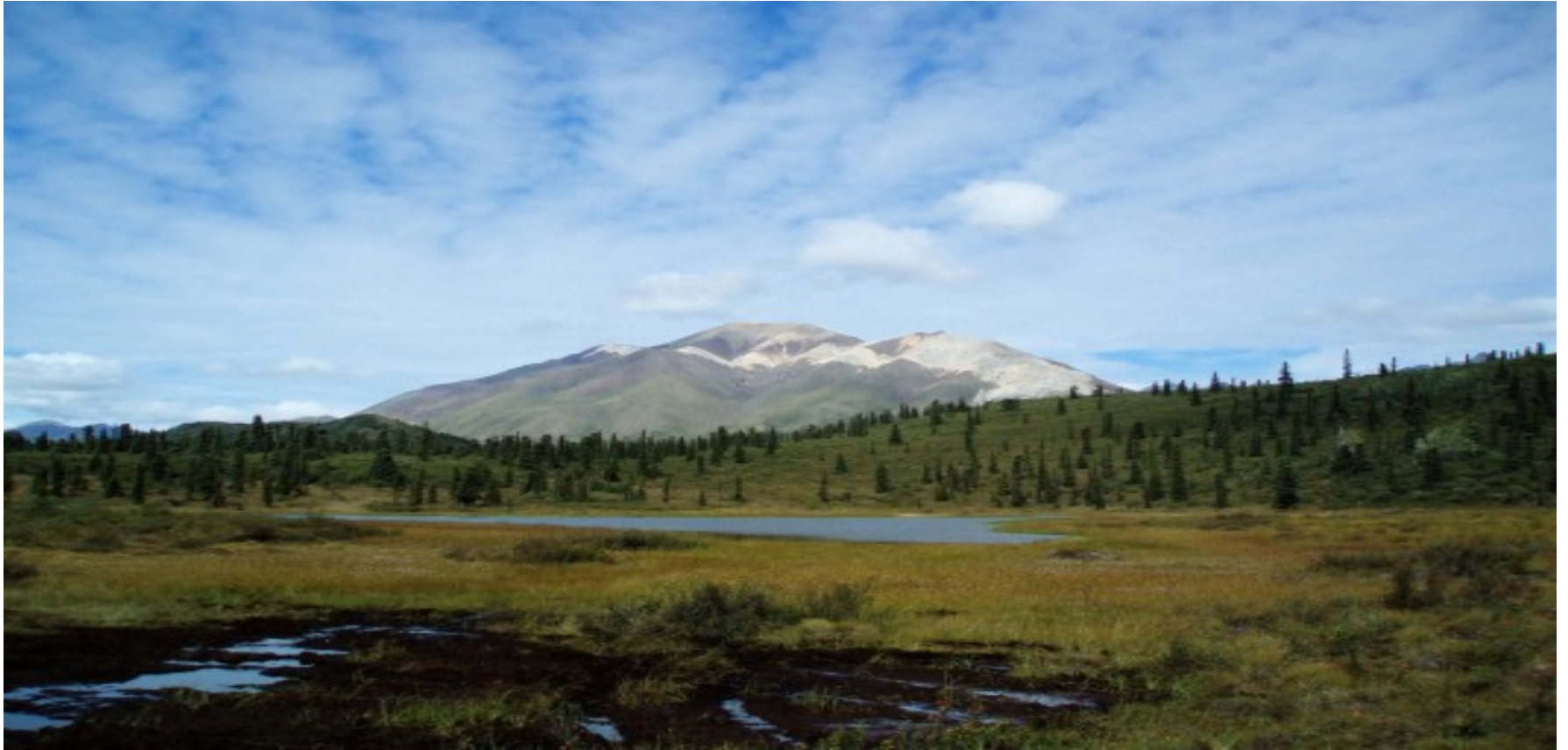
9.- Sistema natural de la reserva de la isla de Wrangel (2004)