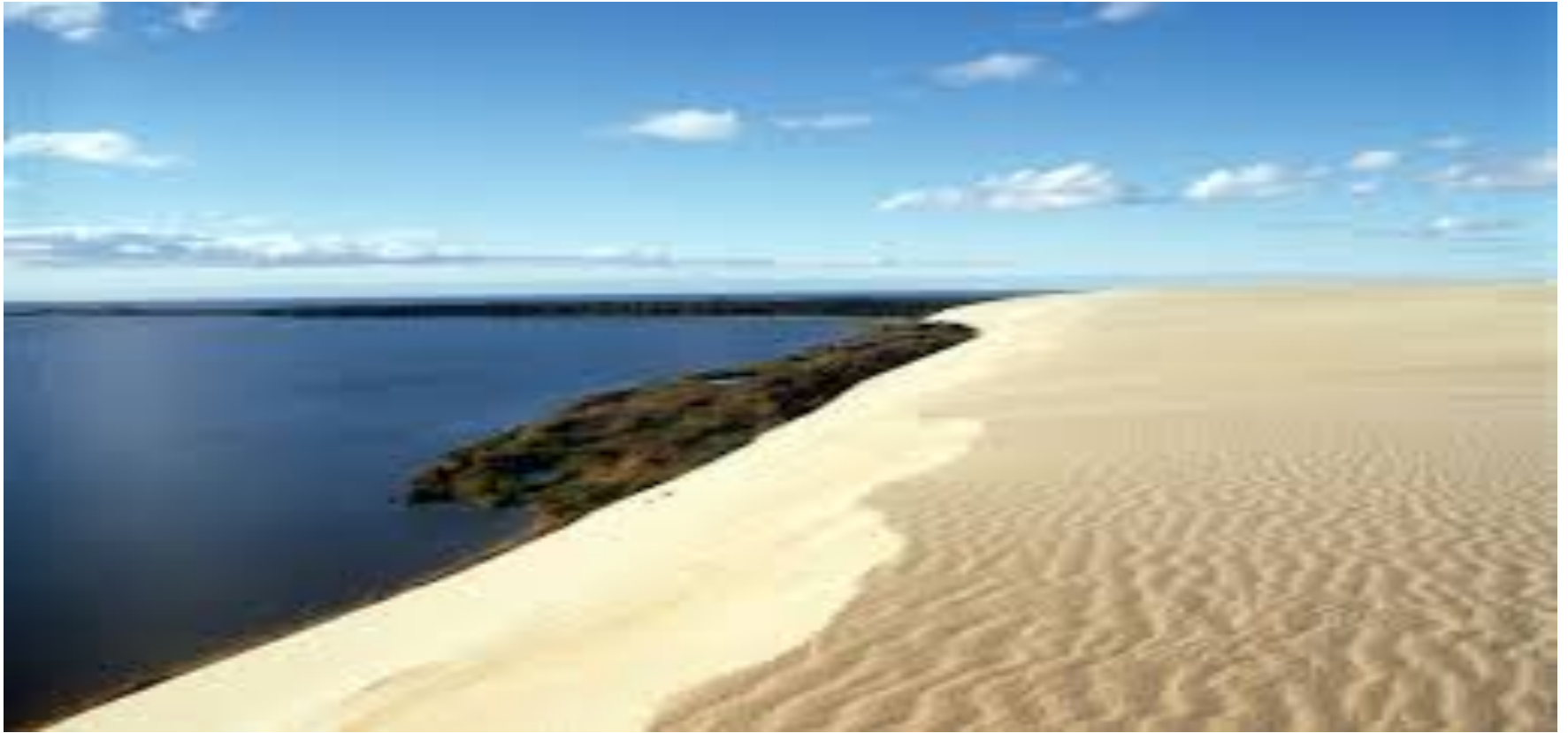
6.- Istmo de Curlandia (2000)