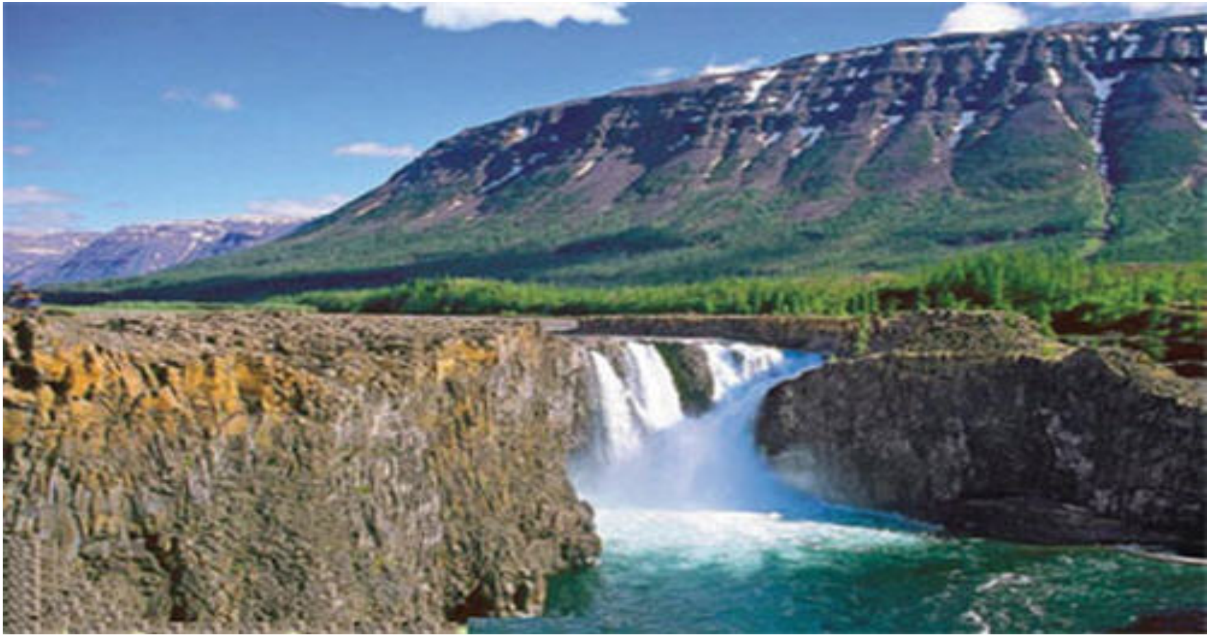
11.- Meseta de Putorana (2010)