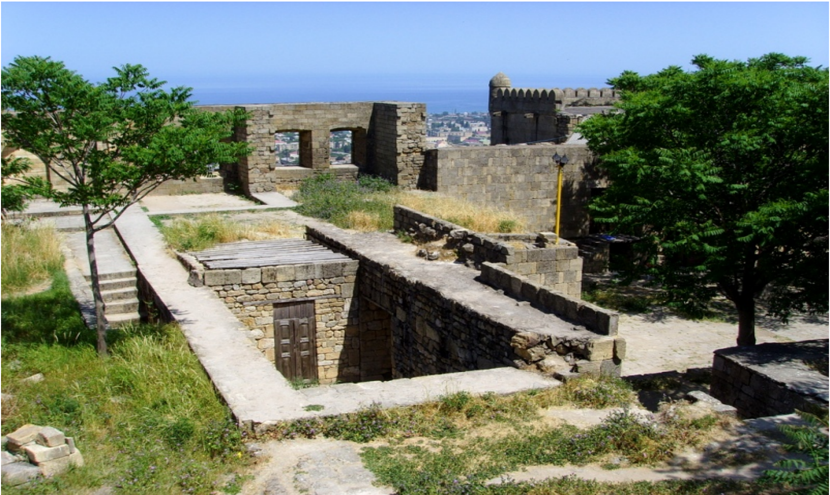
11.- Ciudadela, ciudad vieja y fortaleza de Derbent (2003)