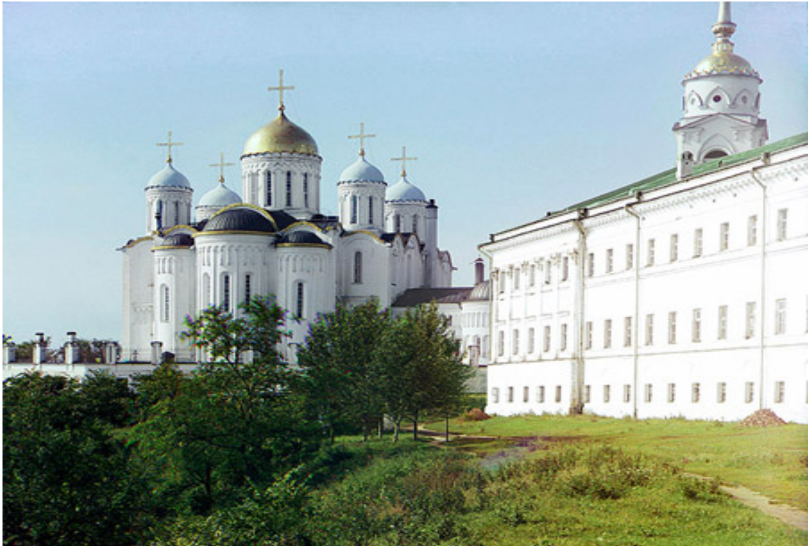
6.- Monumentos Blancos de Vladimir y Sudar (1992)