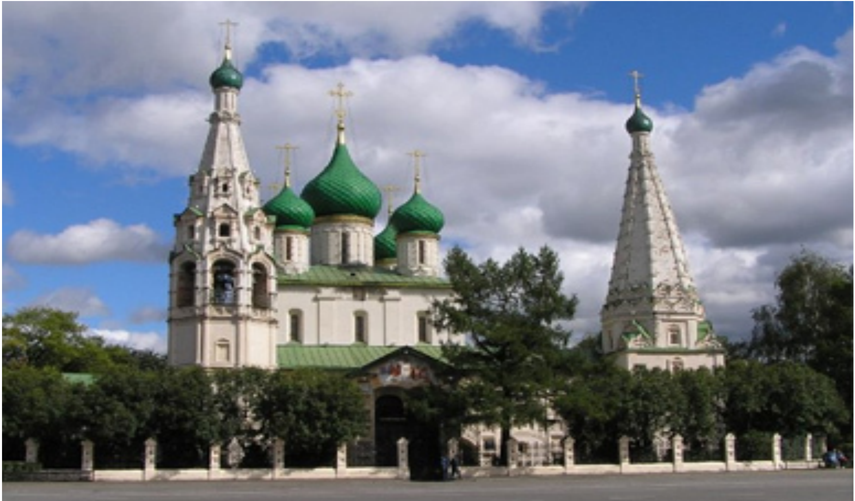
13.- Centro histórico de la ciudad de Yaroslavl (2005)