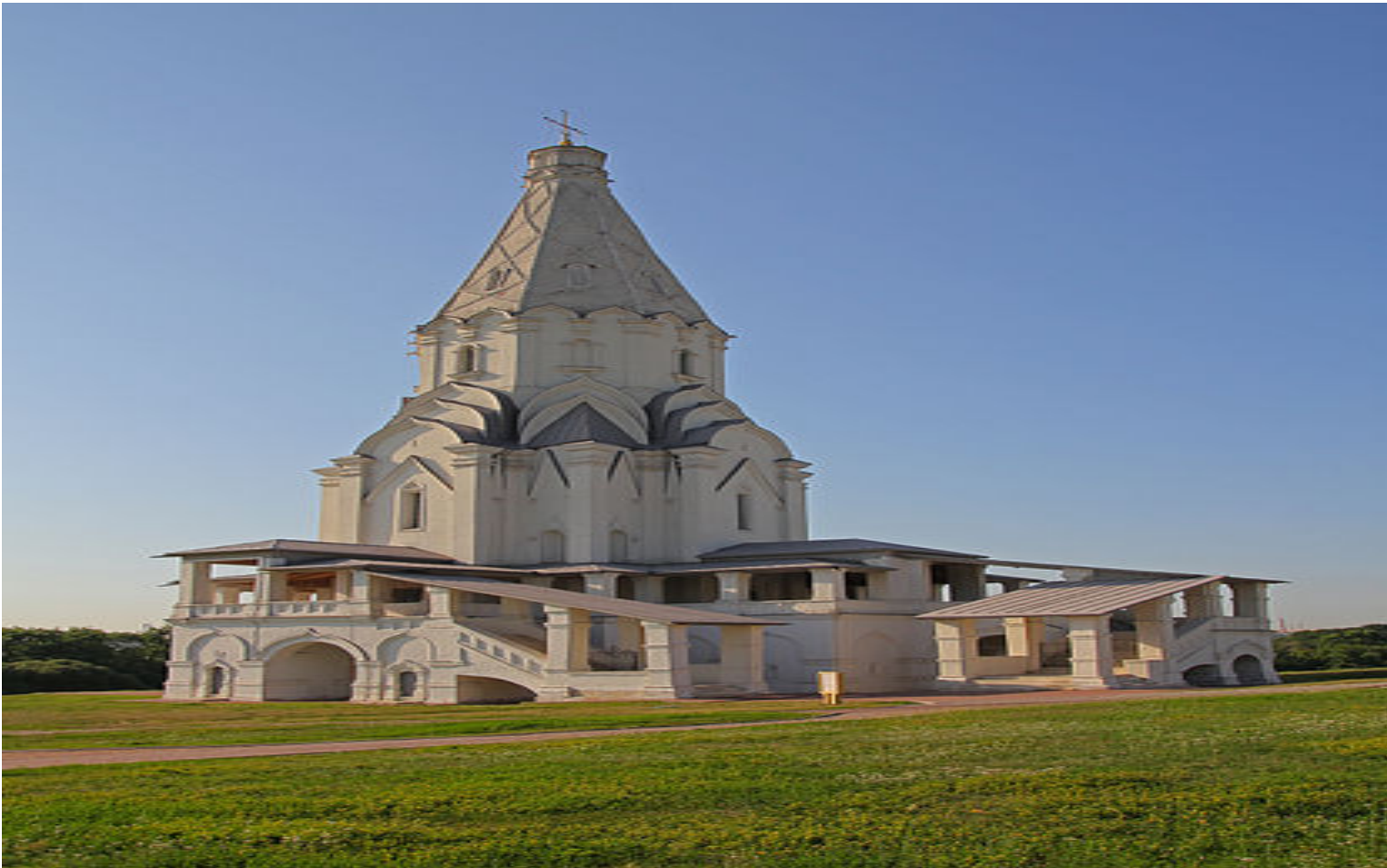
8.- Iglesia de la Ascensión (1994)