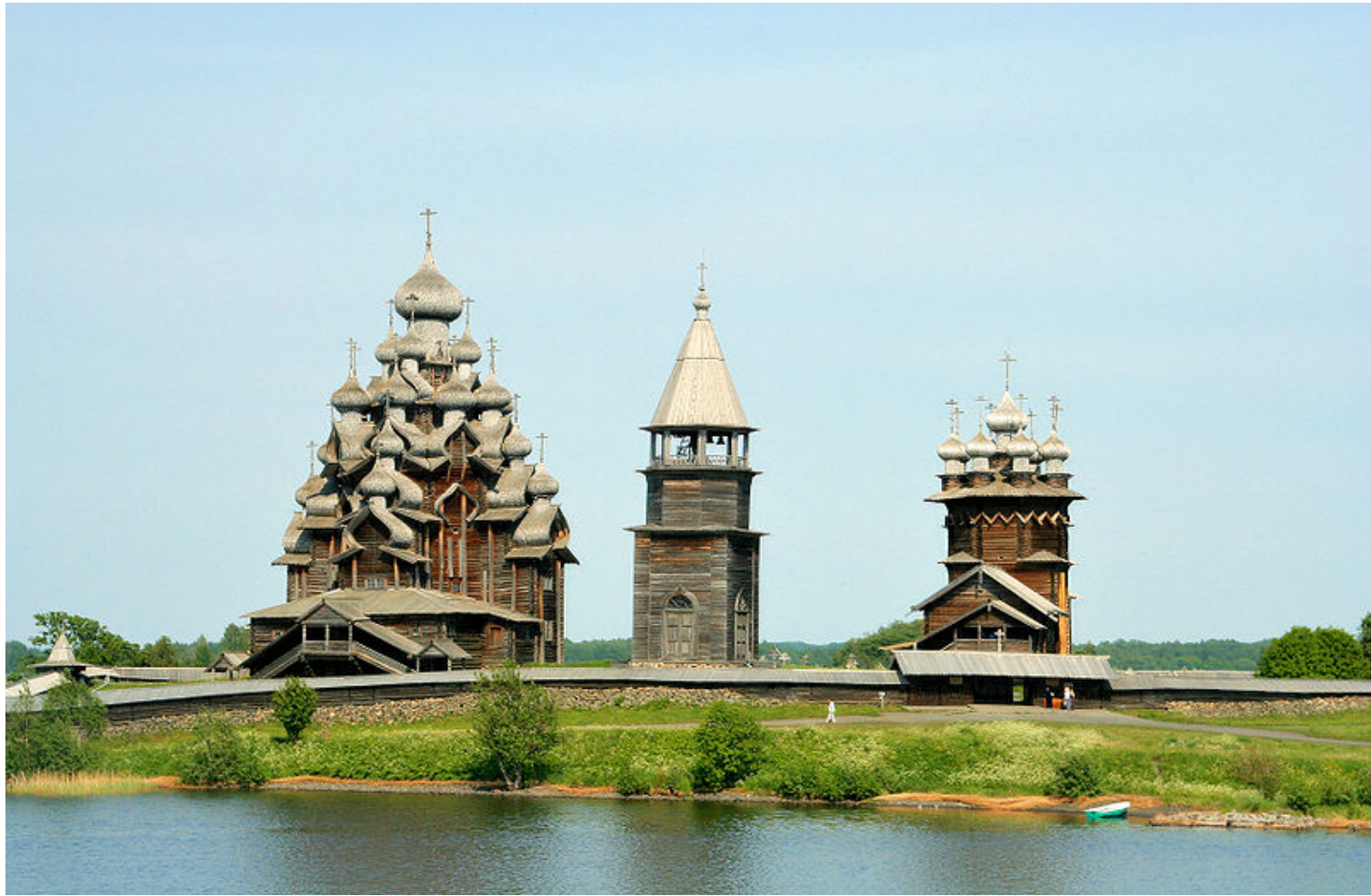
3.- Kizhi Pogost (1990)