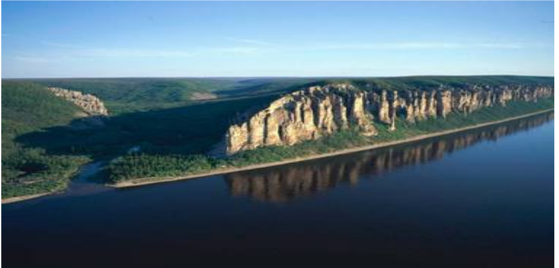
12.- Parque natural de los Pilares de Lena (2012)