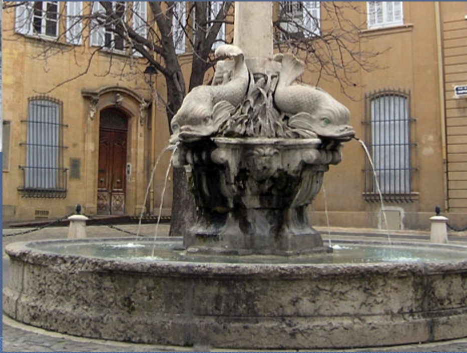
Fontaine Les Quatre Dauphins, Arles

También otros edificios públicos y de ornato, como las fuentes, sirvieron como monumentos y símbolos ideológicos que con el paso del tiempo se volvieron parte del patrimonio monumentalista de Francia.