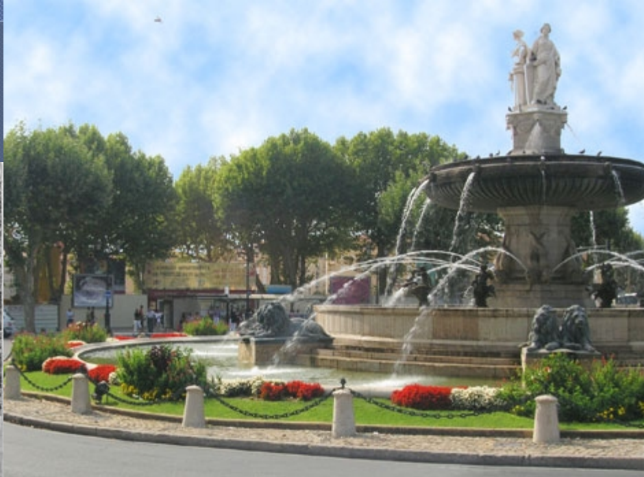
Fontaine La Rotonde

También otros edificios públicos y de ornato, como las fuentes, sirvieron como monumentos y símbolos ideológicos que con el paso del tiempo se volvieron parte del patrimonio monumentalista de Francia.