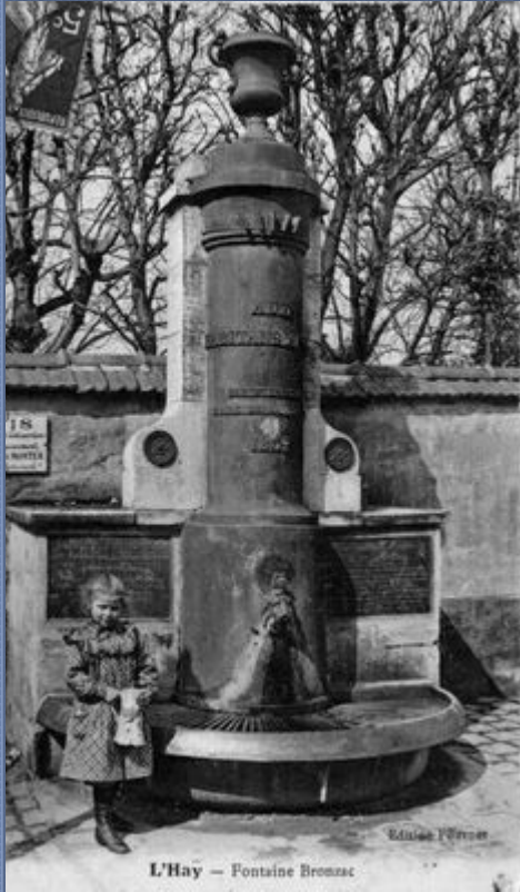
Fontaine Bronzac, L'Hay Les Roses